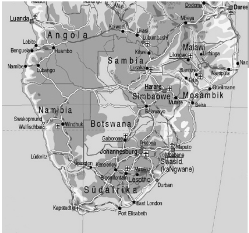
Ingenieurbüro für Kartographie J. Zwick, Gießen (Kartenausschnitt)

Erster Premierminister wurde der pro-britische Bure Louis Botha. Die schwarze Bevölkerung wurde nicht in die Bildung des neuen Staates einbezogen und erhielt keinerlei politische Rechte. Ab 1911 wurde eine Reihe rassendiskriminierender Gesetze erlassen; unter der Regierung der National Party wurde schließlich ab 1948 das Apartheid-Regime systematisch ausgebaut. Die heutige Republik Südafrika entstand 1961, nachdem der Staat wegen des Streits um die international geächtete Apartheid-Politik ein Jahr zuvor aus dem britischen Commonwealth ausgetreten war.